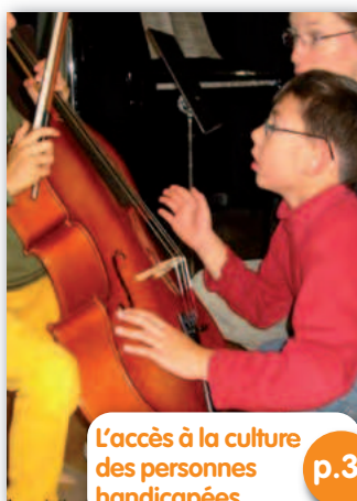
L'accès à la culture des personnes handicapées